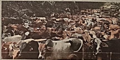
UMAT Islam di Kedah yang bakal melaksanakan ibadah korban perlu mendapatkan permit penyembelihan daripada JPV.

"Kita memohon kerjasama semua pihak yang berhasrat melaksanakan ibadah korban membuat pendaftaran ternakan dan mendapat kebenaran pemindahan ternakan di Pejabat Perkhidmatan Veterinar daerah selewat-lewatnya Khamis ini," katanya.